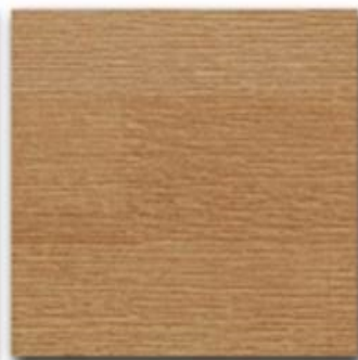
10 - Rovere natural OIL