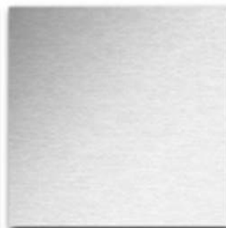
15 - Satinato Acciaio inox