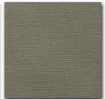
08 - Fumo natural OIL