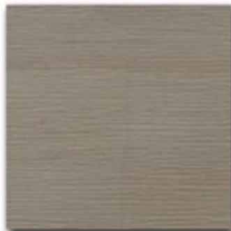
05 - Tabacco natural OIL