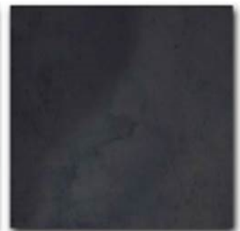
12 - * Brunito synthetic