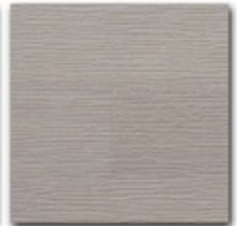
04 - Grigio natural OIL