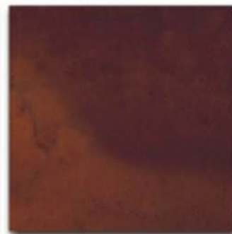
11 - * Ruggine synthetic