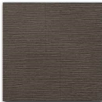
09 - Nero Ebano natural OIL