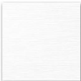
13 - Bianco synthetic