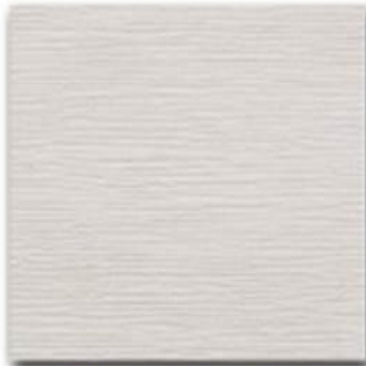
01 - Sblancato natural OIL

Gradini faggio disponibili, senza sovrapprezzo, nella versione liscia o nella versione spazzolata BRUSH (parallela al gradino) o REFIL (perpendicolare al gradino) (CERTIFICAZIONE ANTISCIVOLO ai sensi del D.M. 14/06/1989 n. 236 per i gradini spazzolati)