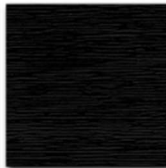
15 - Nero synthetic