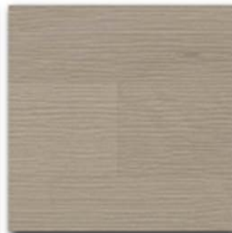
07 - Smoke natural OIL