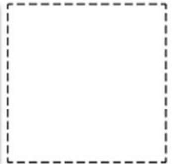
Colore a campione synthetic

Per colore a campione, prevedere maggiorazione.