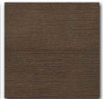
12 - Wengé natural OIL