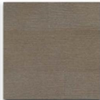
06 - Stone natural OIL