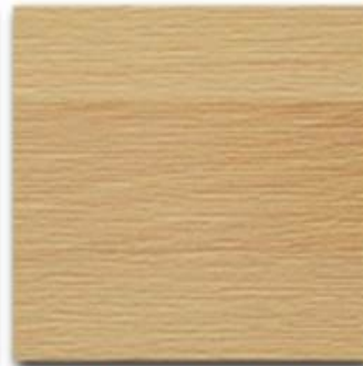
03 - Naturale natural OIL