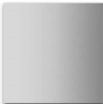
14 - Perlato Acciaio inox