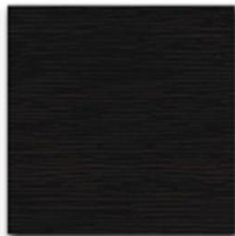
14 - Carruba synthetic