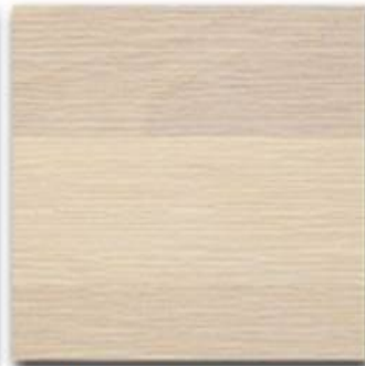
02 - MIK natural OIL