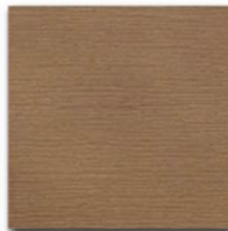
11 - Noce natural OIL