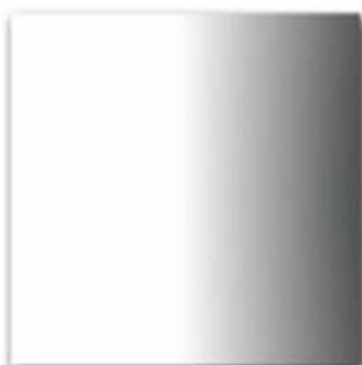
13 - Lucido Acciaio inox